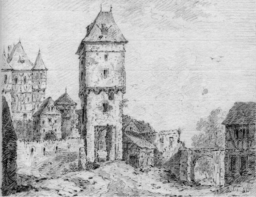
Frankenstein 1775. (Franz Schütz) Stadtarchiv Darmstadt.

Die Burg hat in ihrer langen Geschichte zu keiner Zeit Belagerungen oder irgendwelche kriegerischen Ereignisse ertragen müssen, allein Wind und Wetter haben die Burg zerstört. Als die Gebäude deshalb im 18. Jahrhundert einstürzten, verwendeten die Bewohner der umliegenden Dörfer die Burg als billigen Steinbruch zum Bau ihrer Häuser.