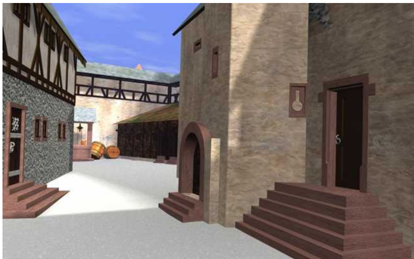
Blick in die enge Kernburg. Rechts das Herrenhaus (Palas) Rekonstruktion von Michael Müller

Rechts neben dem Palas steht der gut erhaltene Küchenbau mit einem Kreuztonnengewölbe im Innern, und wiederum daneben befindet sich der Schutthügel der einstigen Kemenate , des Frauenhauses. Im hinteren Burghof stand das Brunnenhaus. Der mittelalterliche Brunnen , eigentlich eine Zisterne (Regenwassersammler), ist gut erhalten, heute allerdings zugedeckt.