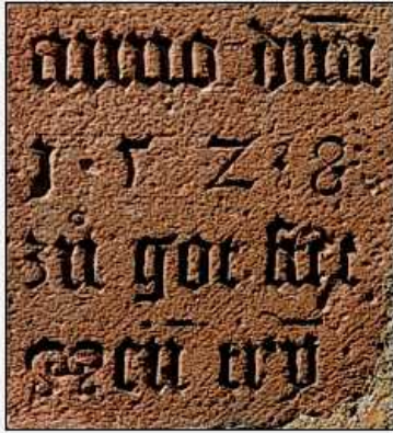
Inscription am Wohnturm: anno domini 1528 zu got stet mein treu