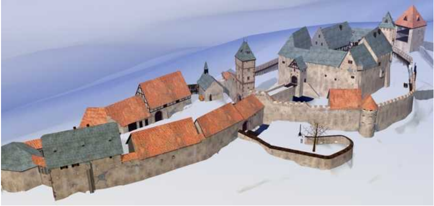
Burg Frankenstein um 1550 von Nordwesten Links die Vorburg , in der Mitte Kapelle und Torturm , rechts die Kernburg , ganz rechts der „ Pulverturm “