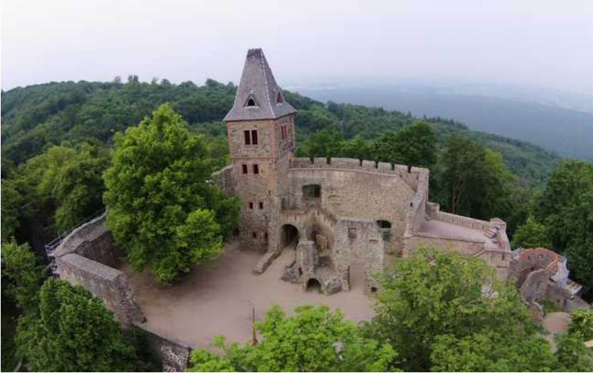
Blick von Osten auf die Kernburg