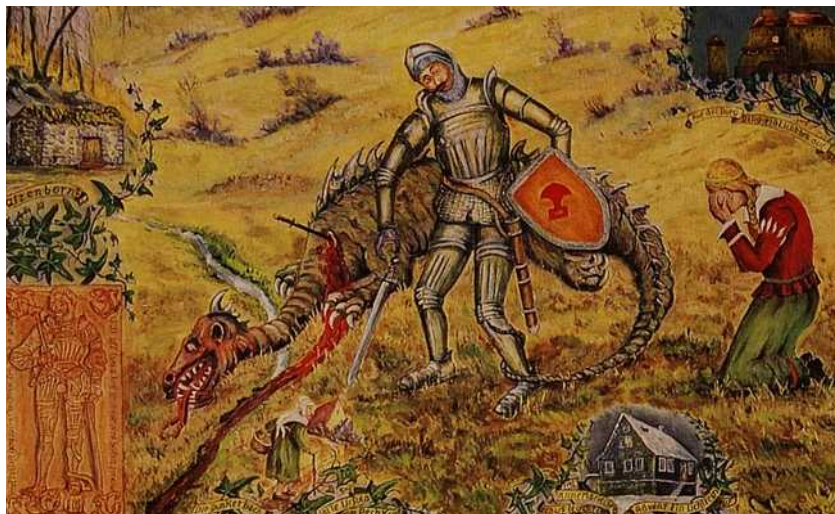
Ritter Georg kämpft mit dem Lindwurm (Gemälde Franz West)

öffneten Knieschiene sein tödliches Gift in dessen Blut. Da lagen nun beide, Sieger und Besiegter, friedlich im Tod nebeneinander. Das schöne Marielien aber, die Rose des Tales, sie sank darauf vor Schmerz und Gram darnieder.