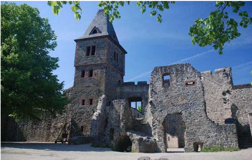
Wohnturm und rechts die Ruine des Herrenhauses (Palas)

In halber Höhe des Wohnturms ist an seiner südöstlichen Ecke eine Steinplatte angebracht mit der Inschrift „Anno domini (im Jahre des Herrn) 1528. Zu got stet mein treu.“ Philipp IV. von Frankenstein wollte hier seine Treue zum katholischen Bekenntnis ausdrücken, nachdem der hessische Landgraf zwei Jahre zuvor die Reformation eingeführt hatte und die kleinen Ritterschaften drängte, dies gleichfalls zu tun. Die Frankensteiner weigerten sich lange, mußten aber dann doch nachgeben.