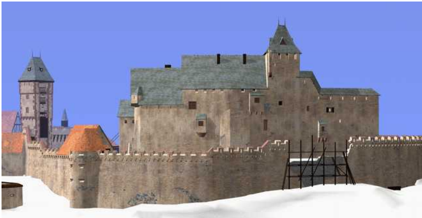
Kernburg von Westen um 1550 (Rekonstruktion: Michael Müller)