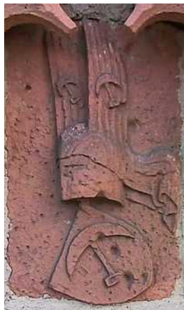
Wappen am Torturm

Über dem Tor ist das Wappen der Herren von Frankenstein zu erblicken mit dem Beil. Der obere Teil des Torturmes mit seinem spitzen Dach ist deutlich als wiederaufgebautes Stück zu erkennen. Besonders bei den verwitterten Sandsteinen der Fenster ist die Grenze zwischen dem erhaltenen Gemäuer des Mittelalters und der späteren Wiederherstellung augenfällig. Der Turm war auf der Rückseite schon immer offen. Falls es Feinden nämlich gelungen wäre, diesen einzunehmen, so hätten sie von der Kernburg aus beschossen werden können.