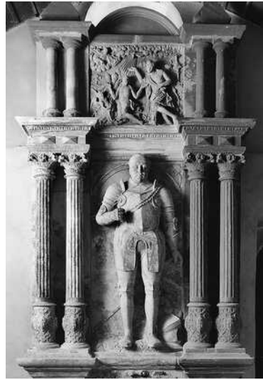
Philipp Ludwig von Frankenstein

Da die Ehe Ludwigs kinderlos blieb, erlosch mit seinem Tod der Bergsträßer Familienzweig. Es erbten die Vettern in Sachsenhausen. In seinem Testament beschwor Ludwig seine Erben eindringlich, Burg Frankenstein niemals an das Haus Hessen gelangen zu lassen. Trotzdem geschah genau dieses 1662.